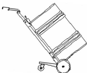
Carro transportador Modelo exclusivo JIT

Las bombas de trasvase se adaptan perfectamente a tambores de 200 litros roscando sobre la boca de los mismos. Vienen provistas con tubo de succión.